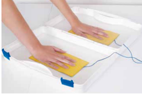
Elektrode met drukknoop-adapter